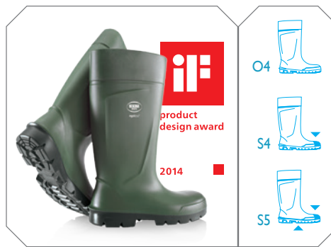
Agrilite® - réf. P2100/9180 (O4) réf. P2300/9180 (S4) - réf. P2400/9180 (S5)